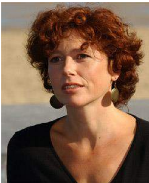
Iciar Bollaín Pérez Mínguez (Madrid 1967).

Debutó como actriz a los 15 años y el director de cine español Víctor Erice la escogió un año más tarde para protagonizar su primera película El sur . Después de esta interpretación, Iciar Bollaín protagonizó diferentes largometrajes, una serie televisiva Miguel de Servet La sangre y la ceniza y una ópera. Estudió en la Facultad de Bellas Artes de la Universidad Complutense de Madrid, pero abandonó los estudios para dedicarse al cine por completo.